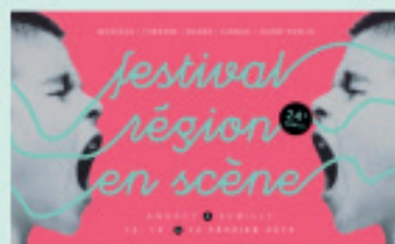
FESTIVAL RÉGION EN SCÈNE