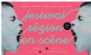
FESTIVAL RÉGION EN SCÈNE