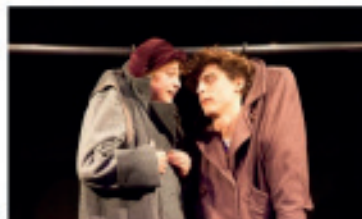
LES DIPTIK PROMUS DANS LES VITRINES INTER-RÉSEAUX