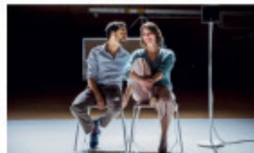
LA CIE JEANNE FÖHN PROMUE DANS LES VITRINES INTER-RÉSEAUX